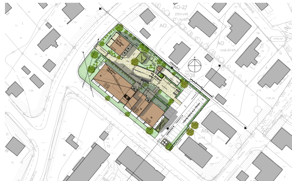
Uudisrakennukset sovitettuna ympäröivään rakennuskantaan

MÄÄRÄYS Lorem ipsum dolor sit amet, consetetur adipisicing elit, sed do eiusmod tempor incididunt ut labore et dolore magna.